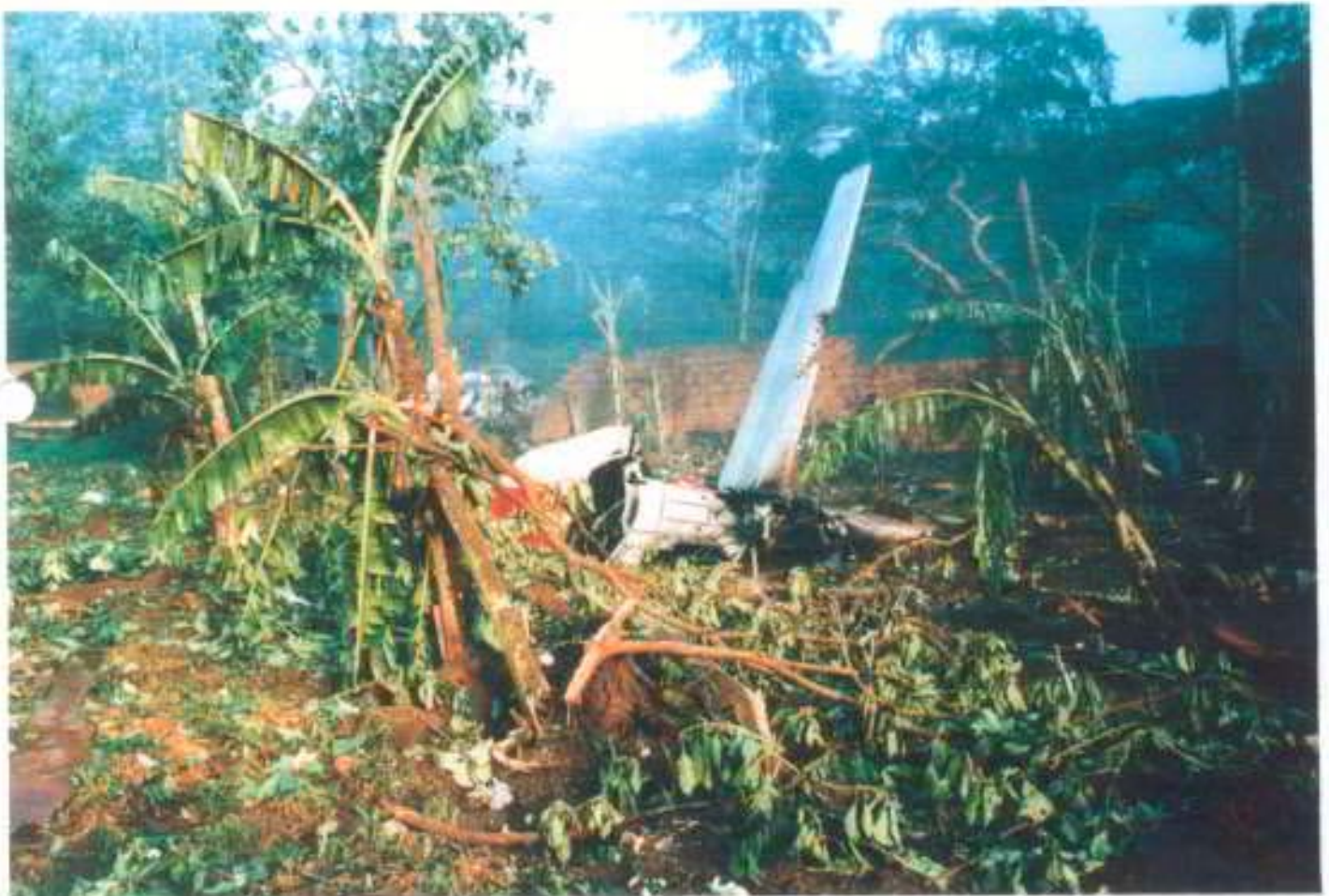
PHOTO 6 - Queue