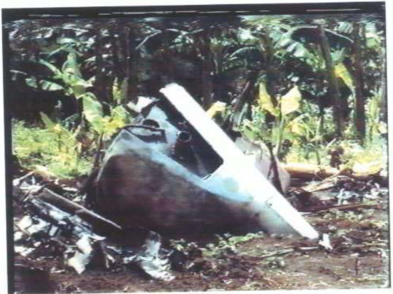
PHOTO 5 - Cône de queue