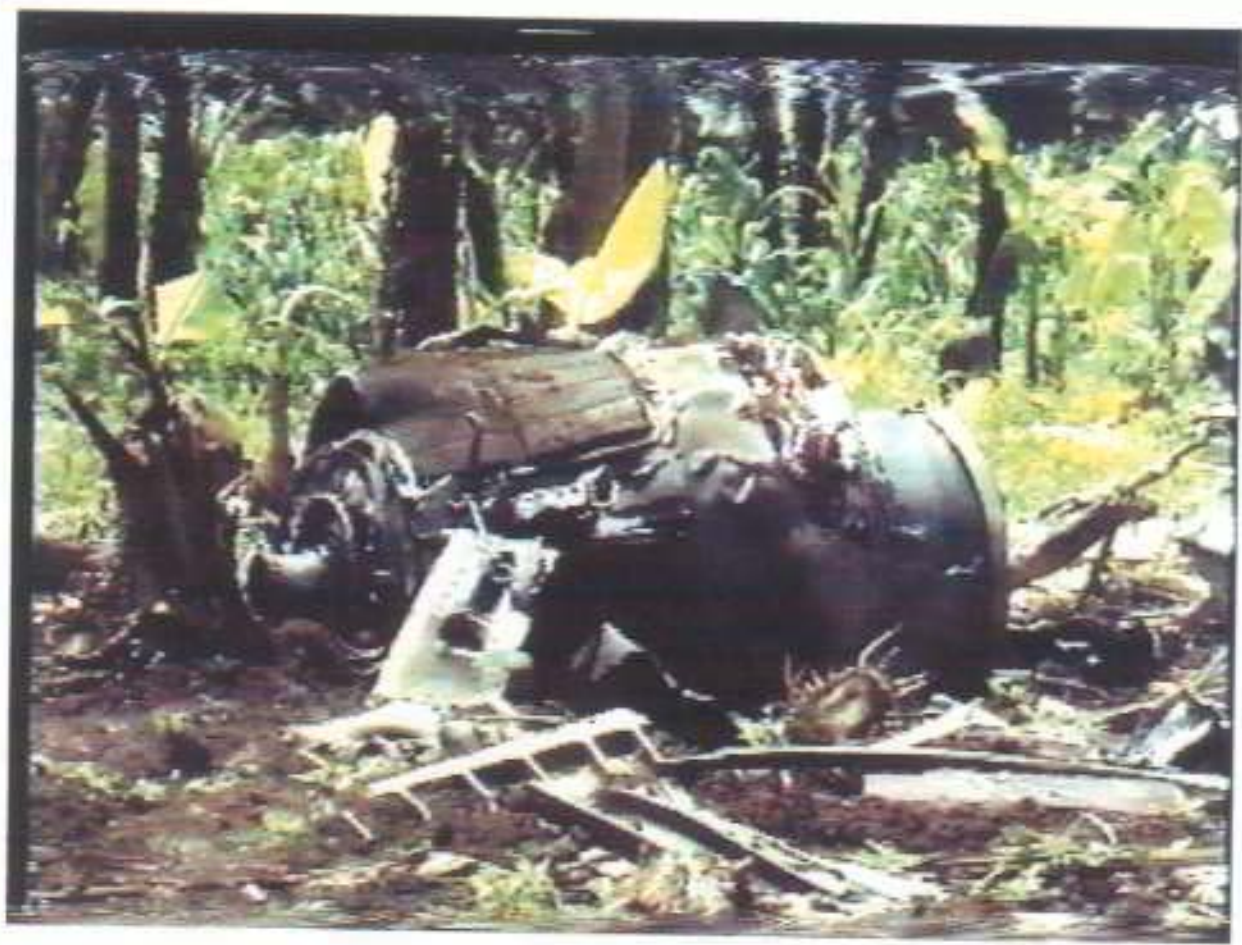
PHOTO 4 - Moteur