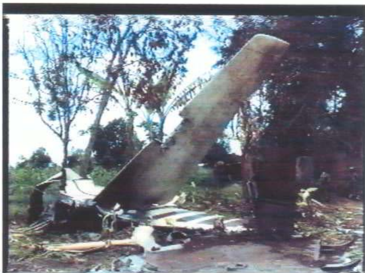
PHOTO 7 - Queue