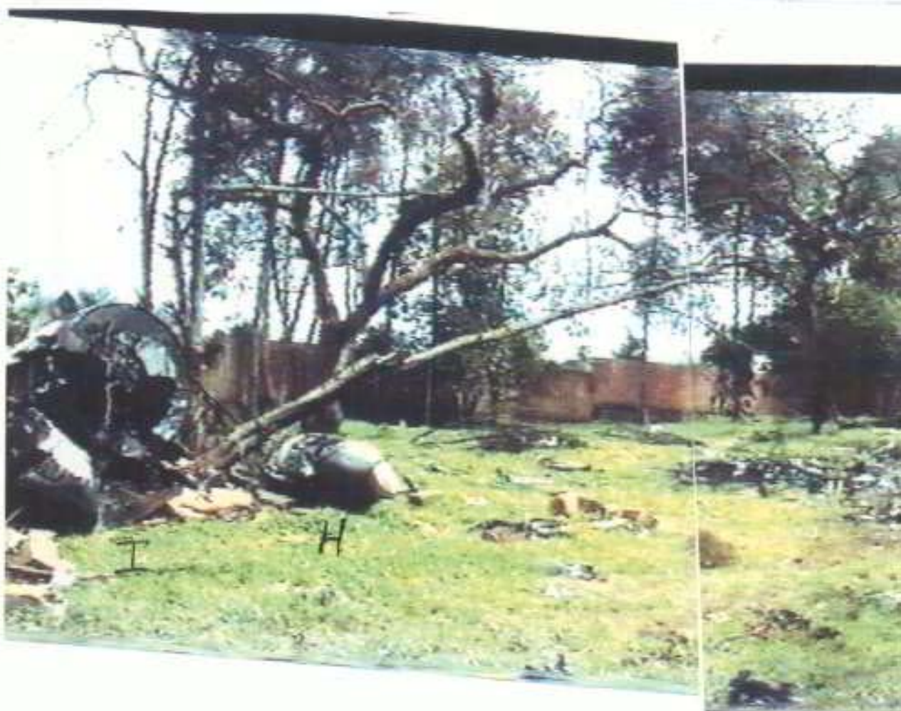
PHOTO 13 - Vue panoramique à l'intérieur de la propriété dos à la trajectoire

Rep H - Moteur Rep I - Partie AR du fuselage Rep J - Débris de fuselage