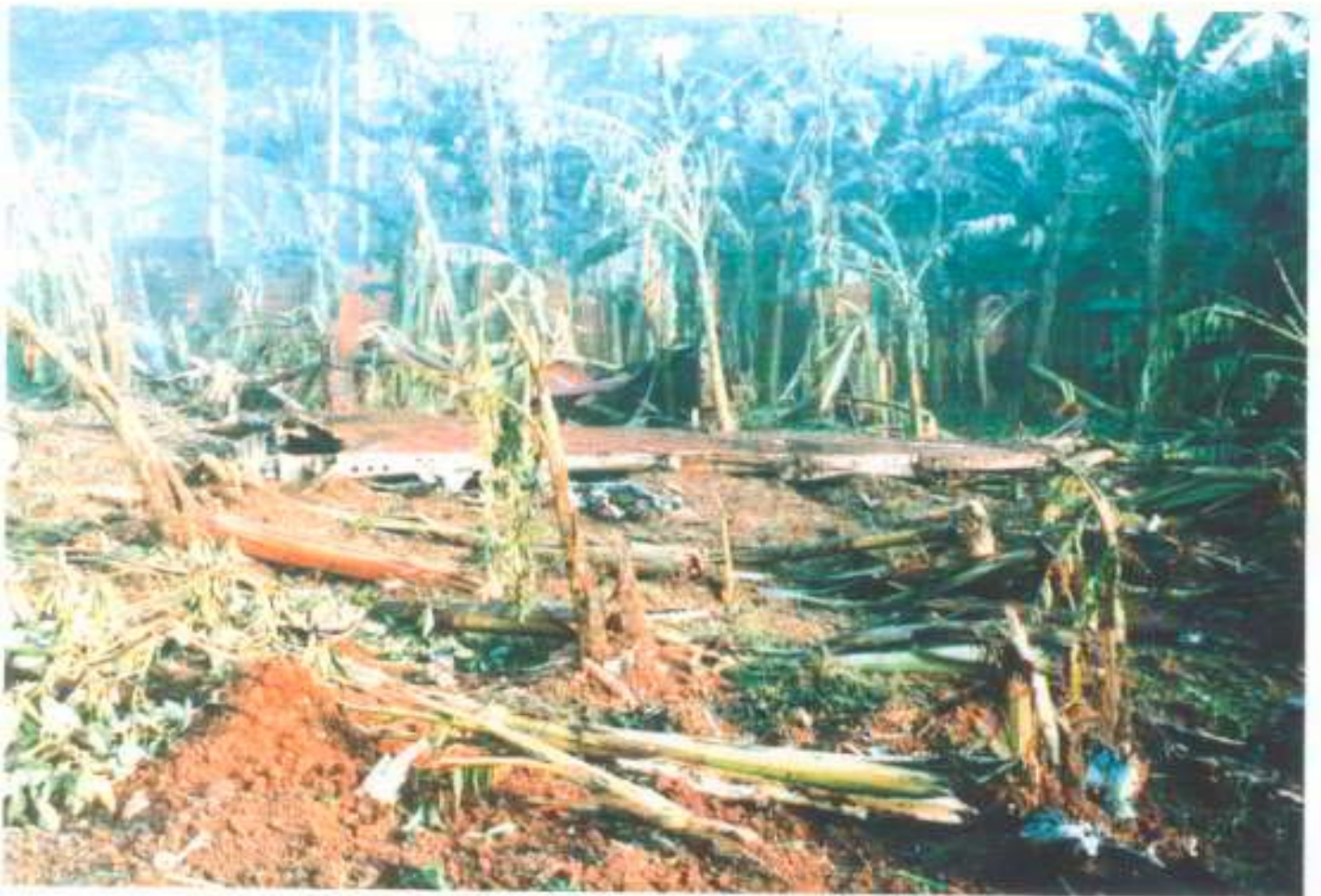
PHOTO 8 - Aile droite