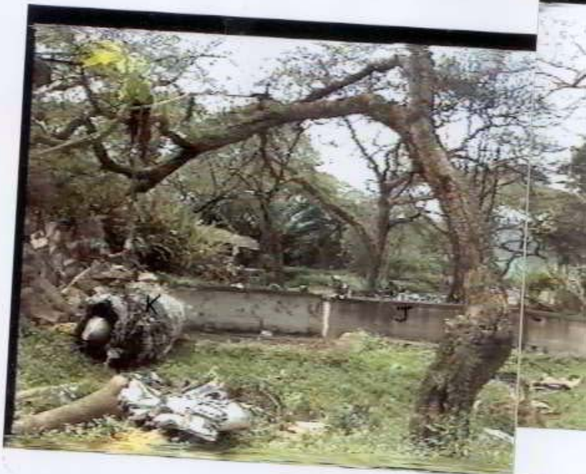
PHOTO 12 - Vue panoramique à l'intérieur de la propriété, toujours face à la trajectoire de l'avion.

Rep I - Partie AR du fuselage Rep J - Débris de fuselage Rep K - Moteur