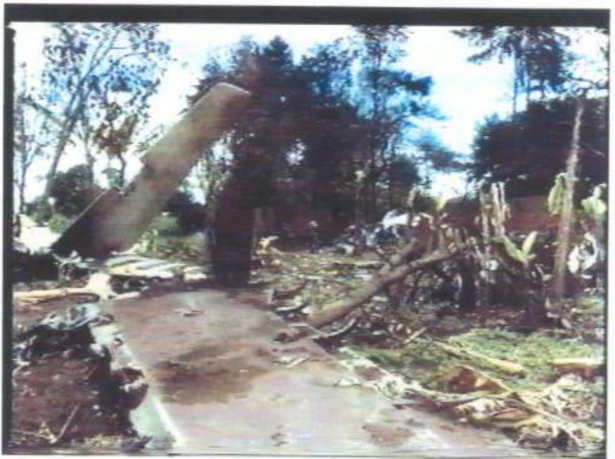
PHOTO 9 - Aile droite et queue