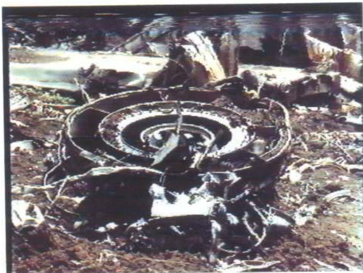
PHOTO 3 - Fan