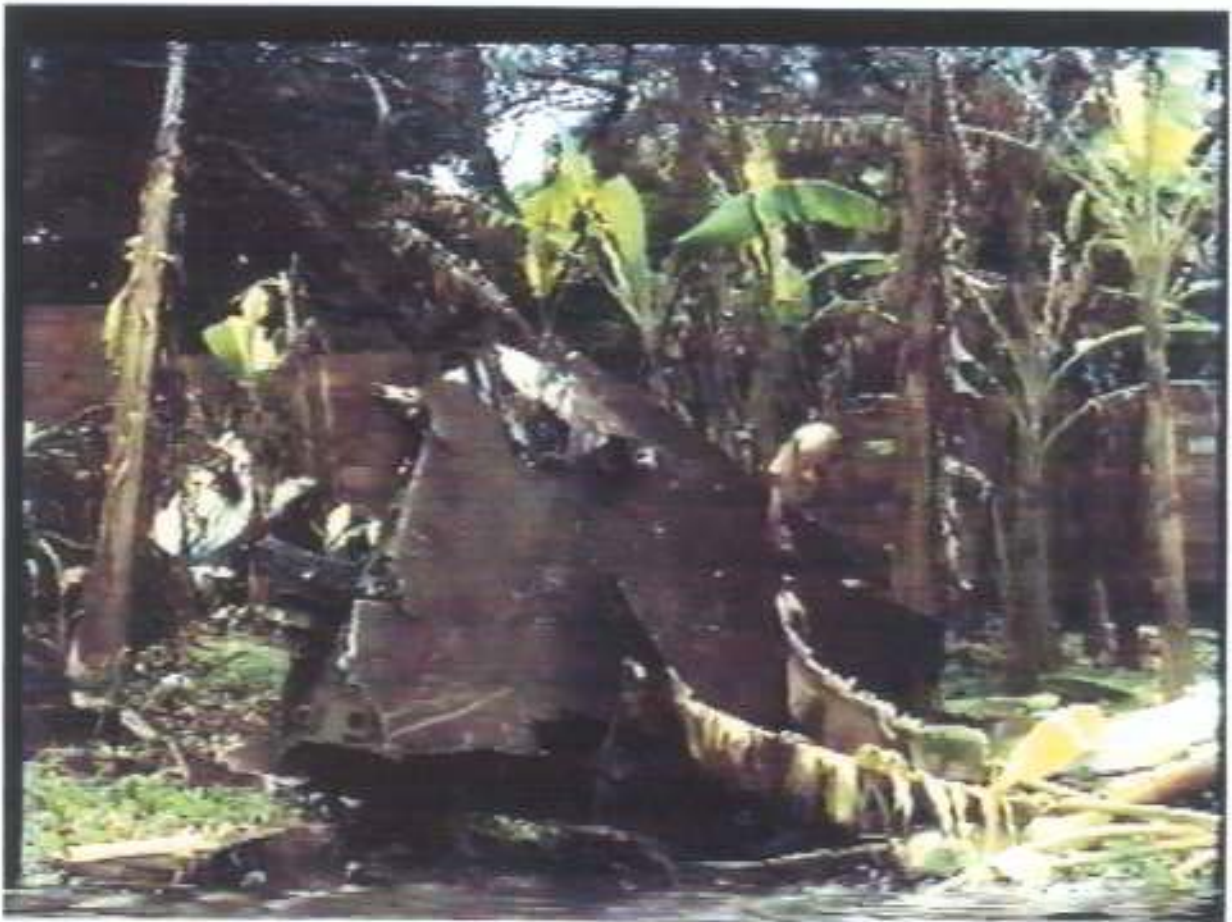
PHOTO 10 - Aile gauche