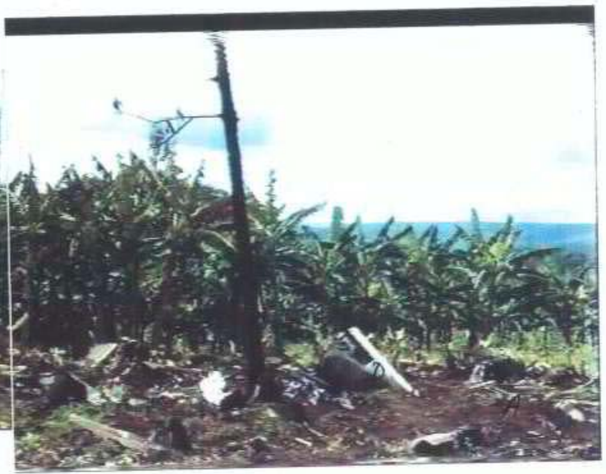
PHOTO 1 - Vue panoramique entre le point d'impact (Kep A) et le mur de clôture de la résidence présidentielle.